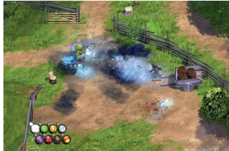
Un des grands plaisirs de Magicka : se mettre sur la tronche entre potes.

Trop de bugs d'affichage ! Y a pas du foutage de gueule dans l'air, là ? - Pas mieux. C'est un saumon qui a dû coder le truc. Avec une interface des années 40 dans l'Arkansas, quoi. Après t'as droit aux vieilles remarques de Deez : « Arrêtez de jouer à ça, vous allez aussi me voir en 3 images/seconde » ! Pfff, barbu, va ! - M'enfin ! C'est quoi, ce bordel ? Un hack'n slash sans loot, sans statistiques de personnage et quasiment sans équipement ? Mais c'est une blague ? T'imagines un Diablo où tu débutes avec un mage de niveau 99 ? Aucun intérêt. Et ce tutorial fané. « Glace la rivière pour éviter la noyade » ! « Électrifie