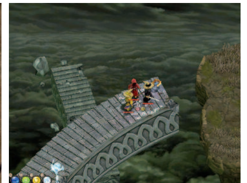
Sundin, Lucky et Death Pote, au bout du monde...