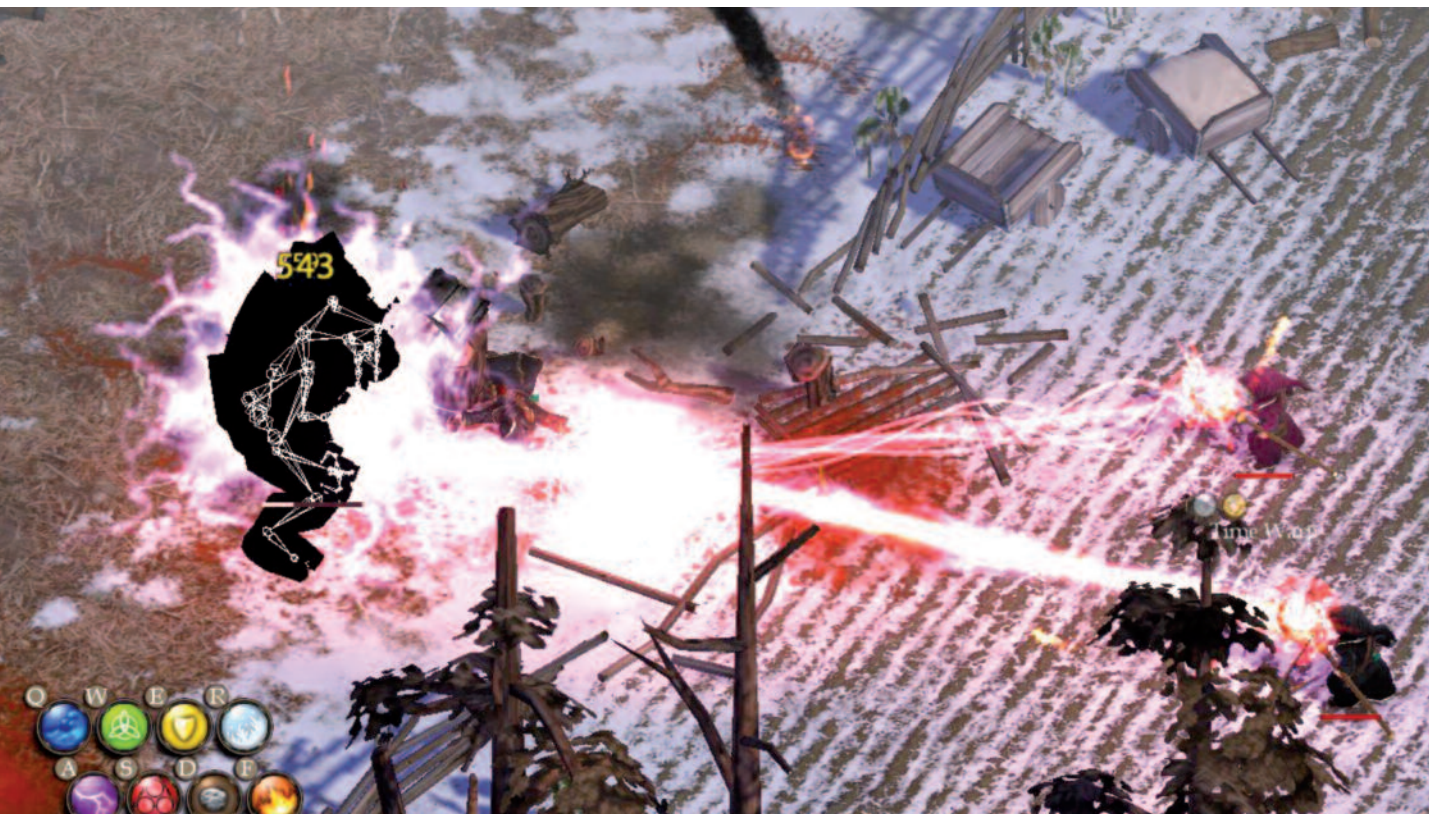
Plus on est de fous, plus on a de chance de griller tout ce qui passe.

le générateur pour ouvrir la porte » ! C'est un jeu d'aventure, on s'est plantés ! - Fané, fané, souviens-toi quand je t'ai électrocuté les miches (et que t'en es mort) pour me sauver d'un vieux goblin qui me picorait le haut du dos. Et souviens-toi quand je t'ai d'abord balancé un rayon de flotte, puis que je t'ai comboté une pluie de pierres électriques ? Et quand j'ai fait cet AOE de glace chargé à fond sur le boss du chapitre 3, puis que j'ai balancé ma pluie de glace avec mes doigts de poule ! Heiiinnn ? Bon, non sans déconner, ce gameplay basé sur 8 éléments (eau, terre, feu, froid, foudre, vie, bouclier, arcane) est une saloperie de bonne idée ! - Vois la meute de gobelins qu'on va se prendre sur la tronche ! On peut en combiner combien ? Cinq sorts ? Attends, moi, je balance un rayon d'arcane avec deux foudres et deux