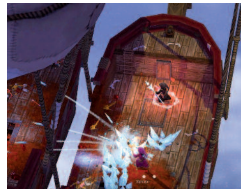
Sur mon bateauuuuuuuuuu ! (légende de respiration).

Outre les trilliards de pouvoirs élémentaires que l'on peut combiner pour les balancer sur soi, devant soi, autour de soi ou sur le soi des autres, on trouve ça et là dans le jeu des « sorts tout faits ». Faire pleuvoir la graisse, des météores, ralentir le temps... Chaque jour, on découvre de nouvelles possibilités. La seule limite, c'est votre créativité !