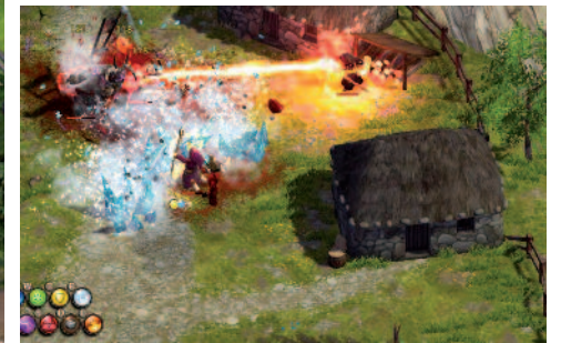
Et comme on dit chez nous : On your bread.