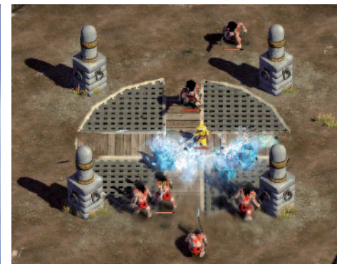
Magicka propose également un mode Épreuves.